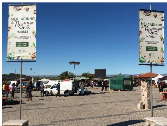
Tabela 19: Ocupação mensal do Mercadinho da Ria

Nota: Foram adquiridos 2 pendões bilingue para sinalizar a entrada norte do Mercadinho e publicitar o mesmo com o dia e horário de realização.