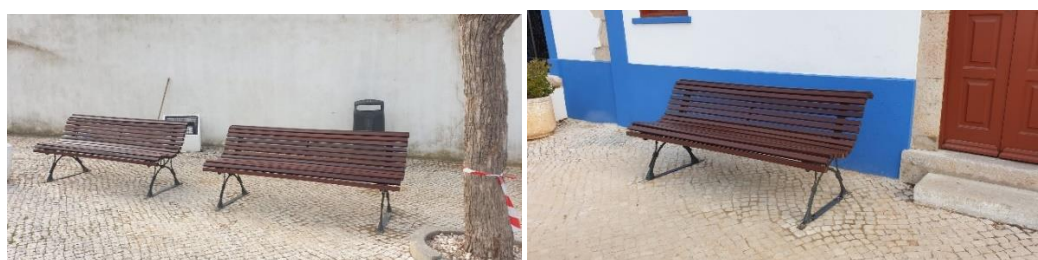
Renovação dos bancos do Adro da Igreja Paroquial de Alvor.