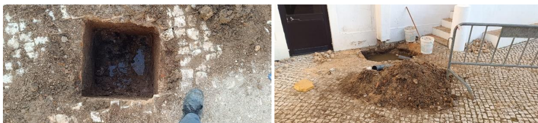
Rutura de água no Pátio do Palácio Abreu.