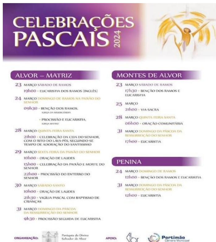
Tabela 18: Eventos e atividades diversas